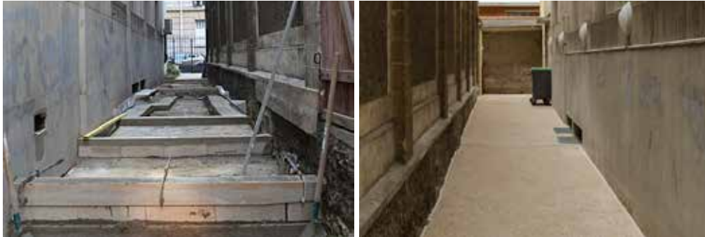
La rampe d'accès pour les personnes à mobilité réduite a été financée, à notre demande, par la Mairie de Paris.