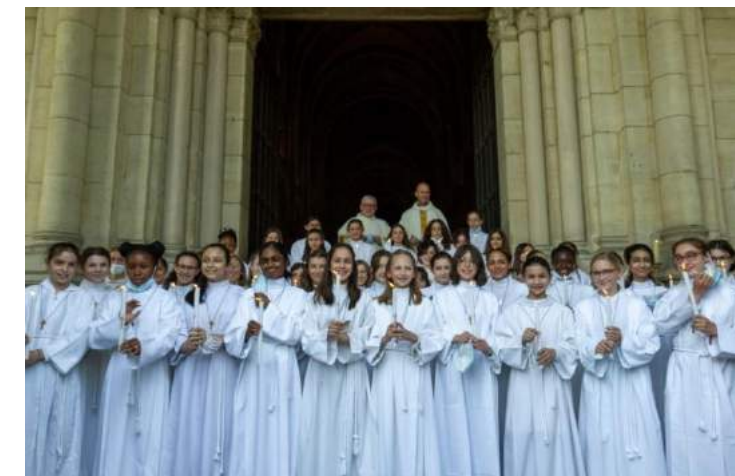
Profession de foi