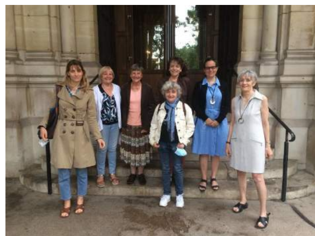
Groupe Prière des mères