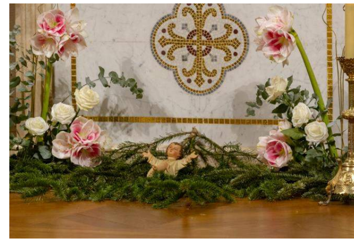
Noël à Saint-Ambroise