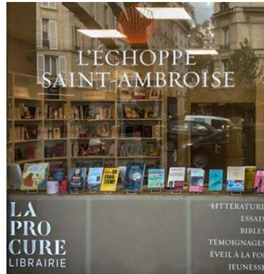
L'échoppe Saint Ambroise