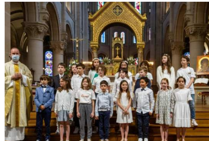
1 ère communion