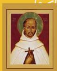
Saint Jean de la Croix

Du vendredi 24 juillet au soir, Au dimanche 2 août midi