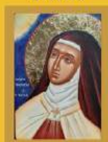
Sainte Thérèse d'Avila