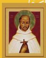
Saint Jean de la Croix

Du vendredi 24 juillet au soir, Au dimanche 2 août midi